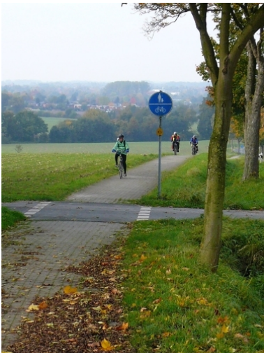
Anstieg bei Coesfeld

Im Laufe der Fahrt beschlossen wir, einen kleinen Umweg durch das Merfelder Bruch zu machen und die dortige letzte europäische Herde von Wildpferden zu besuchen. An der Kasse zeigte man sich angesichts der Größe der Gruppe verhandlungsbereit was den Eintrittspreis anging – beim Verlassen der Wildpferdebahn revanchierten wir uns durch ein längeres Beratungsgespräch in Sachen Fahrradkauf. Die meist mausgrauen Wildpferde sind durch einen doppelten Stacheldrahtzaun von den Besuchern getrennt, wahrscheinlich um die wilden Pferde vor den noch wilderen Menschen zu schützen. Die Herde wird weitestgehend sich selbst überlassen, nur einmal im Jahr werden die Tiere in einer Art Arena getrieben und die jungen Hengste aussortiert. Diese Maßnahme ist notwendig, weil sich die nunmehr geschlechtsreifen Tiere heftigste Kämpfe um die Rangfolge liefern würden. Zu dem ist in der Wildpferdebahn kein Platz für eine größere Herde. Die Tiere werden nach dem Fang im Schnitt für 300 Euro versteigert, sie gelten als außerordentlich genügsam, geduldig und kinderlieb.