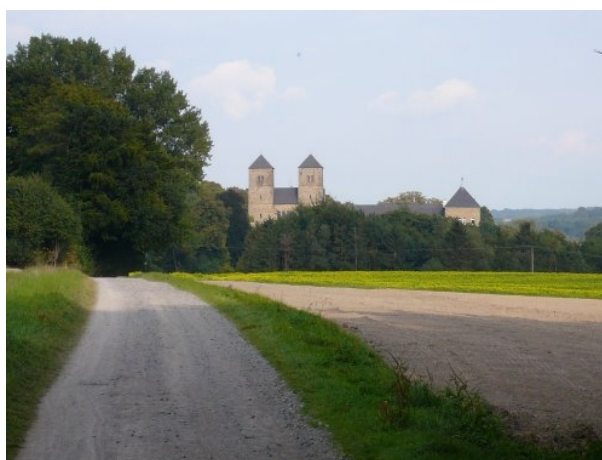
Die Abtei Gerleve aus westlicher Richtung

Zu Mittag haben wir dann in der Benediktinerabtei Gerleve gegessen. Das Kloster liegt etwa 5 Kilometer von Billerbeck entfernt auf einem westlichen Ausläufer der Baumberge. Die Mönche halten die Gastfreundschaft hoch, was sich unter anderem auch im klostereigenen Restaurant mit seiner Speisekarte äußert. Für kleines Geld gibt es hier richtig etwas auf die Gabel; will heißen: Man wird satt bei wohlschmeckendem Essen. Nach dem Essen war noch ein Besuch in der gut sortierten Klosterbuchhandlung fällig, bevor es über Dülmen nach Sythen zum Bahnhof ging. Vorher fuhren wir noch in Karthaus vorbei, einem ehemaligen Karthäuserkloster in der Nähe von Dülmen. Vom Kloster stehen noch einige Nebengebäude und die heutige Pfarrkirche, deren geschmiedete Chorschranke im Inneren sehr sehenswert ist. Am Ende des Tages waren 80 Kilometer mehr auf dem Tacho zu verzeichnen und alle waren zufrieden mit dem Erlebnis zweier Tage auf dem Fahrrad.